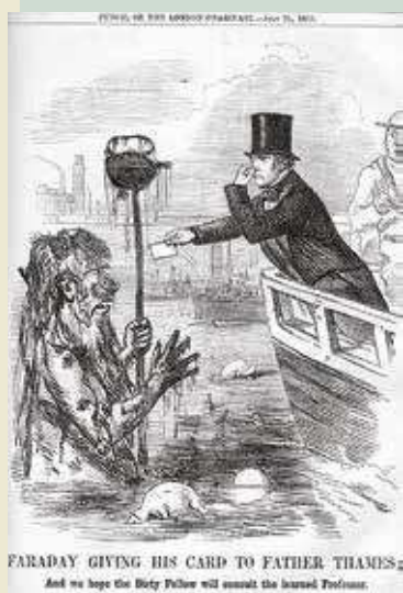
Caricatura publicada al diari The Times el juliol del 1855. El científic anglès Michael Faraday dona una targeta al Pare Tàmesi, sobre l'estat del riu.

Tot i que no es va parlar d'ecologisme fins als anys 70, el moviment no va néixer d'un dia per l'altre. A finals del segle XIX, diversos pensadors i naturalistes ja posaven de manifest la necessitat de preservar la natura, evitant qualsevol alteració humana. En aquest context, destaca especialment la figura de John Muir (1838-1914), el qual va tenir un paper molt important en la protecció d'espais naturals als Estats Units i va fundar el 1892 la primera entitat conservacionista de la història, el Sierra Club , que avui dia continua sent una icona de l'ecologisme a tot el món.