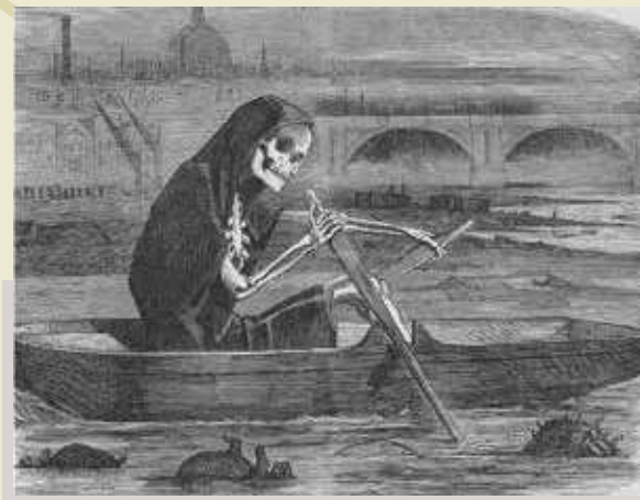
The silent highwayman. Your money or your life. Caricatura publicada el 10 de juliol del 1858 a la revista Punch . La mort ronda sobre el Tàmesi, reclamant la vida dels qui no paguen per la neteja del riu.

Un dels casos de més ressò va tenir lloc durant el segle XIX al Tàmesi, el qual va assolir uns nivells de contaminació que van extingir completament la vida al riu . Tot i així, l'aigua se seguia utilitzant per al consum humà, cosa que va donar lloc a greus epidèmies de diftèria i va ocasionar més de 35.000 morts entre el 1831 i el 1866. L'estiu de 1858 va ser extremadament càlid, cosa que va fer que els bacteris prosperessin encara més. El riu feia tanta pudor que a aquest període se'l coneix amb el nom de Great Stink («la Gran Pudor»).