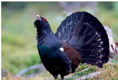
Gall fer 3