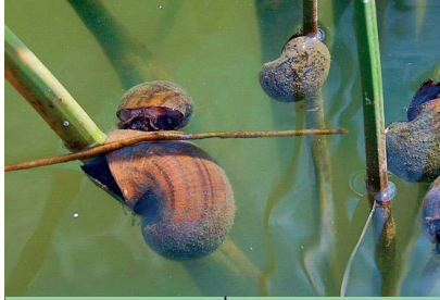
Cargol poma 1