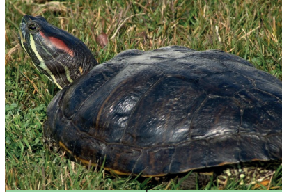
Tortuga de Florida